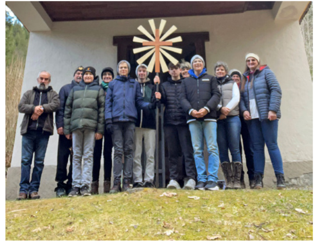
Kreuzweg auf den Kalvarienberg, 24.03.2024