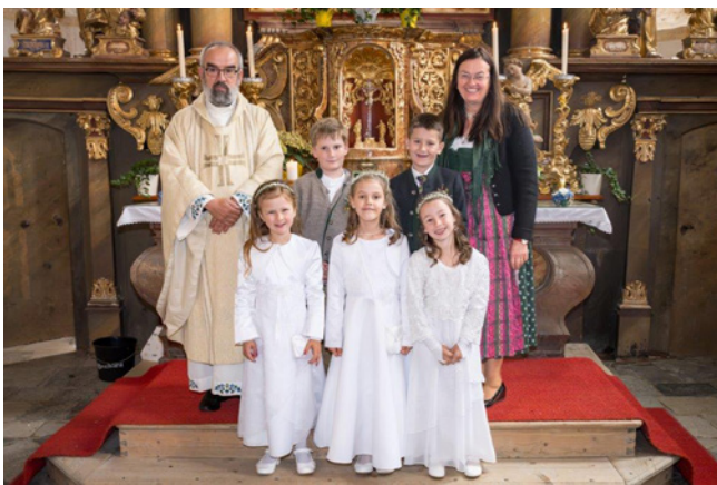
Am 16. Juni erhielten 3 Mädchen und 2 Burschen von Herrn Pfarrer anlässlich der "Erstkommunion" zum ersten Mal das "hl. Brot".